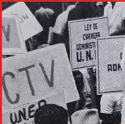
Principios de la CTV