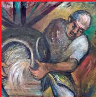
El futuro de la libertad sindical y la CTV