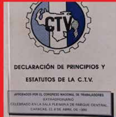
Estatutos de la Confederación de Trabajadores de Venezuela